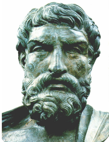
ΕΠΙΚΟΥΡΟΣ ΑΘΗΝΑΙΟΣ ΤΩΝ ΔΗΜΩΝ ΓΑΡΓΗΤΤΙΟΣ